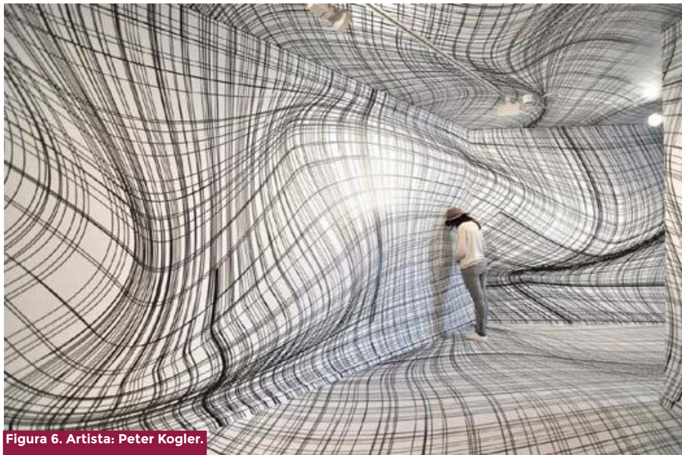
Figura 6. Artista: Peter Kogler.

para laborar. Es por ello que se fue estableciendo una nueva configuración de poder: «El Biopoder se transformó en un elemento indispensable para el desarrollo del capitalismo de la modernidad tardía, ya que este, como explica Foucault, “no pudo afirmarse sino al precio de la inserción controlada de los cuerpos en el aparato de producción y mediante un ajuste de los fenómenos de población a los procesos económicos” » (12) (Figura 7).