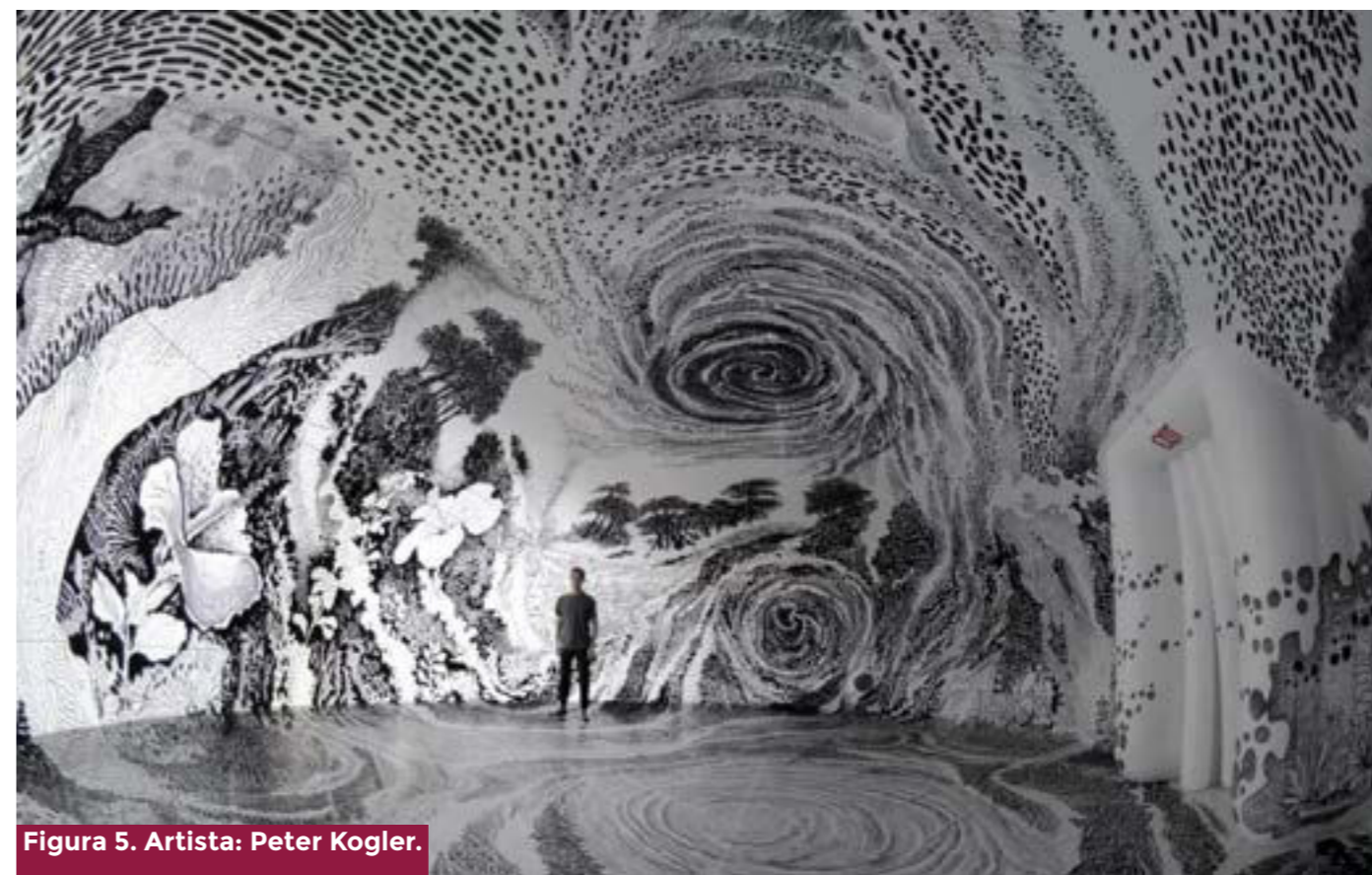
Figura 5. Artista: Peter Kogler.

Es decir, tendríamos un servidor proporcionando una tarea a un dispositivo de un utilizador dado al cual se está acoplado. Así, puede comunicar con el servidor. ¡Voilà! Un sensor acoplado o incluido en el dispositivo de un usuario puede detectar la actividad corporal del usuario ».