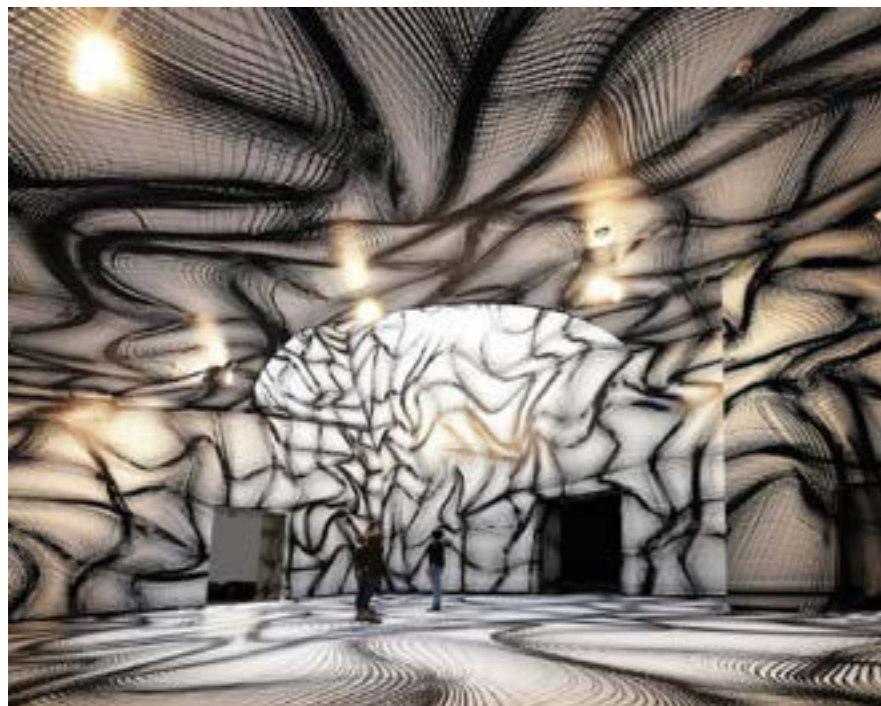
Figura 8. Artista: Peter Kogler.

en una nueva era de descubrimientos y manipulaciones en lo biológico. Es decir, nos insertamos, nos incrustamos, desde lo tecnológico, en el interior de la propia naturaleza como lo cita Slavoj Zizek: « Es la propia naturaleza la que se esfuma: la principal consecuencia de los avances científicos en la biogenética es el final de la naturaleza. Una vez conocidos los mecanismos que rigen su construcción, los organismos naturales quedan transformados en objetos susceptibles de manipulación » (16) . Por ello, continúa Zizek, « [...] Con los últimos avances, el malestar pasa de la cultura a la propia naturaleza: la naturaleza ya no es «natural», ya no es el fiable trasfondo «denso» de nuestras vidas; ahora parece un mecanismo frágil que, en un momento dado, puede explotar de manera catastrófica » (ibid).