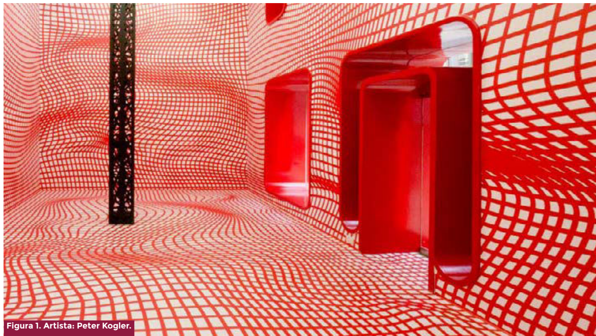
Figura 1. Artista: Peter Kogler.

Sí, porque el exceso de contacto humano ha sido confinado, limitado a las demarcaciones de sus espacios domésticos, una “balsa” al estilo la «Stultifera navis» de Sebastian Brant (1494) ( ibid ). Pero, además, el sujeto queda enmarcado en un mundo virtual, digitalizado, donde todo parece