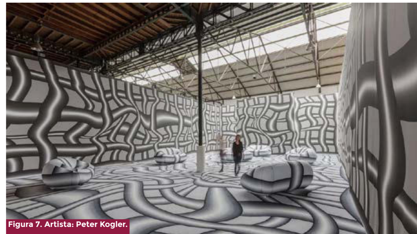
Figura 7. Artista: Peter Kogler.

Pero sabemos que hoy, con los avances biotecnológicos y genómicos, hemos entrado