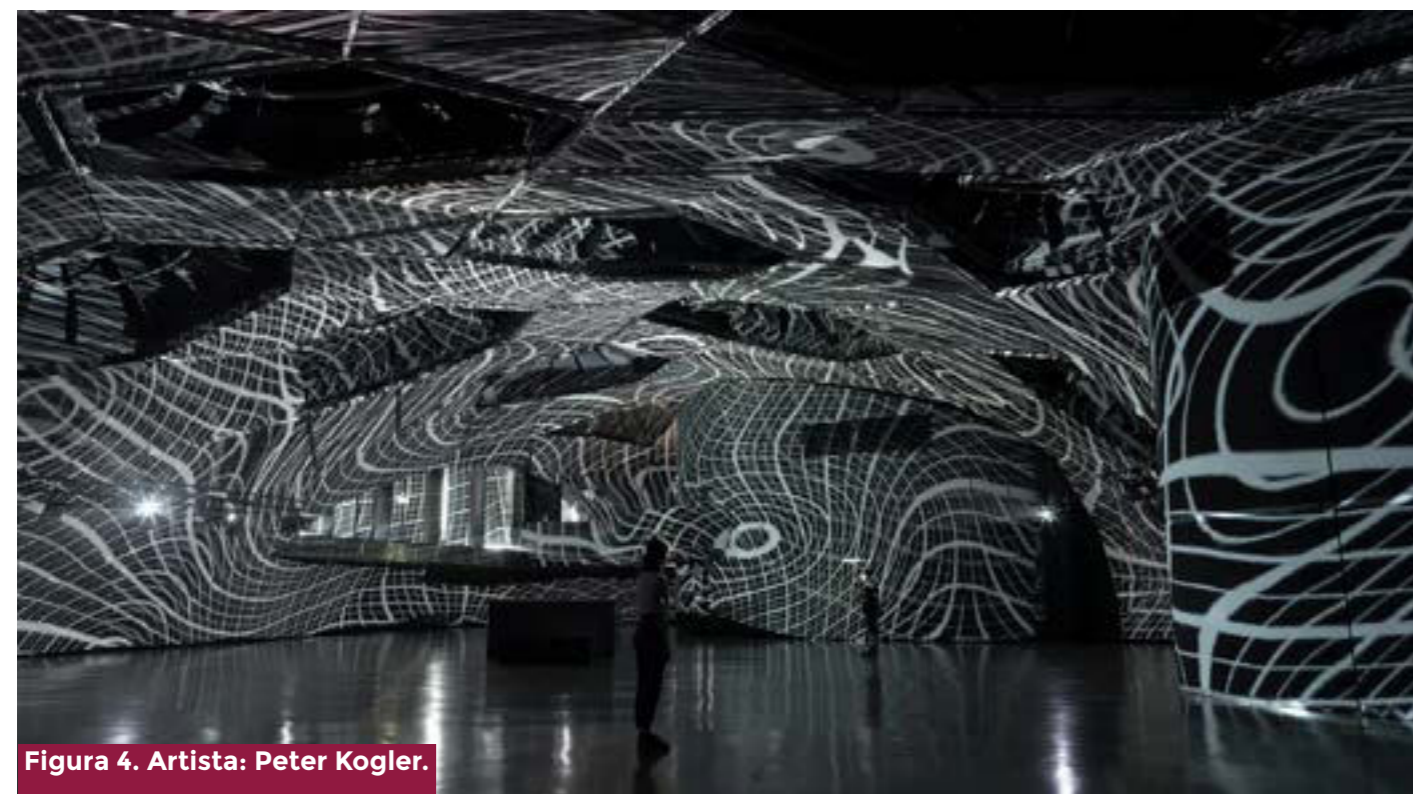
Figura 4. Artista: Peter Kogler.

En medio del juego, « El cuerpo aparece como sujeto privilegiado de las nuevas configuraciones del poder » (9) , de toda nueva configuración de poder. Y así tenemos que en un futuro inmediato, en esas nuevas configuraciones de poder, tenemos