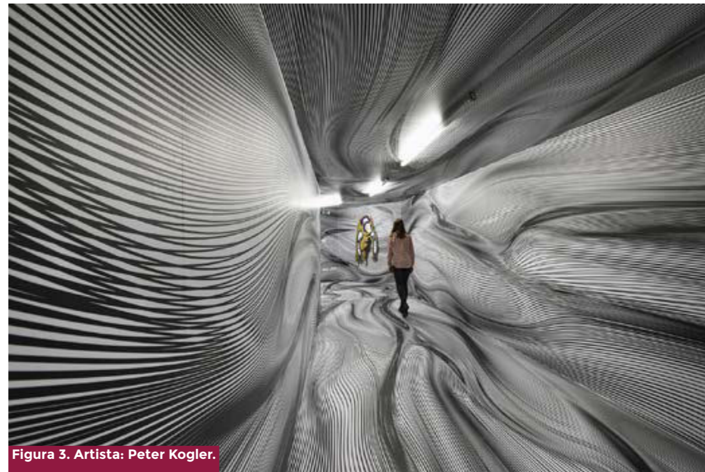
Figura 3. Artista: Peter Kogler.

De manera que Foucault logra vincular al sujeto de la Modernidad en su subjetividad a su cuerpo, pero en su materialidad corporal respecto a las estrategias casi obligantes a la normalización: «Foucault descubre que las técnicas de sujeción y de