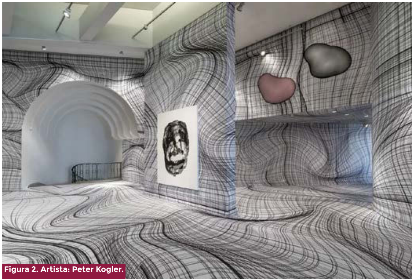
Figura 2. Artista: Peter Kogler.

En sus escritos, Michel Foucault, pareciera sugerir que el sujeto humano deviene objeto sobre el cual se despliegan ejercicios de poder. Aunque en el concepto foucaultiano de biopolítica el orden de discusión es a nivel poblacional y no individual, el sujeto inevitablemente se encontrará, p. ej., en el decurso de una pandemia, instrumentalizado en una serie de códigos normativos, regulatorios, legales que tienden a otorgar una mayor preeminencia a aquellas propuestas que conllevan prohibiciones que a aquellas que pudiesen estar centradas en el buen vivir, calidad de vida, entre otros términos. Por ello, la pandemia COVID-19 nos reta en el accionar, en la praxis, porque la pandemia nos expresa taxativamente que «el cuerpo que experimenta de manera cada vez más intensa la indistinción entre política y vida ya no es el del individuo; tampoco el cuerpo soberano de las naciones, sino el cuerpo, a la vez desgarrado y unificado, del mundo» (3) .