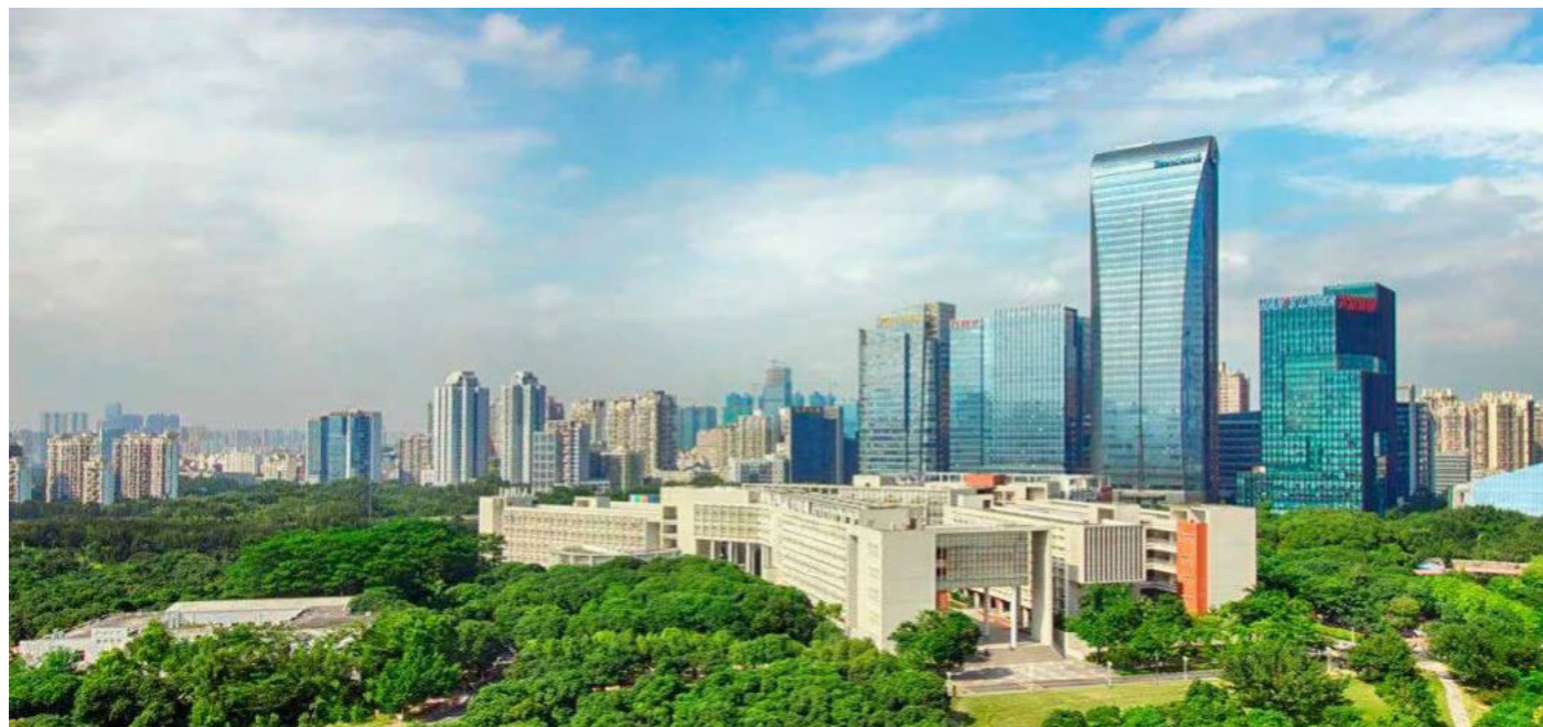
Figura 5. Universidad de Shenzhen es una universidad completa a tiempo completo acreditado por el Consejo de Estado de la República Popular de China y es financiado por el gobierno local de Shenzhen. SZU se fundó en 1983 y realizó su primera inscripción el mismo año en lo que Deng Xiaoping llamó "Velocidad de Shenzhen".

mundiales más grandes y se ha adaptado a las necesidades del mercado y de las industrias, por lo que ofrece un lugar para la descentralización, la autonomía y la pertenencia a una región geográfica de importancia. Gracias a ello la región de Guangdong tuvo un repunte y originó el mayor crecimiento entre las ZEE y Hong Kong ha sido la fuente más importante de IED en China (5) .