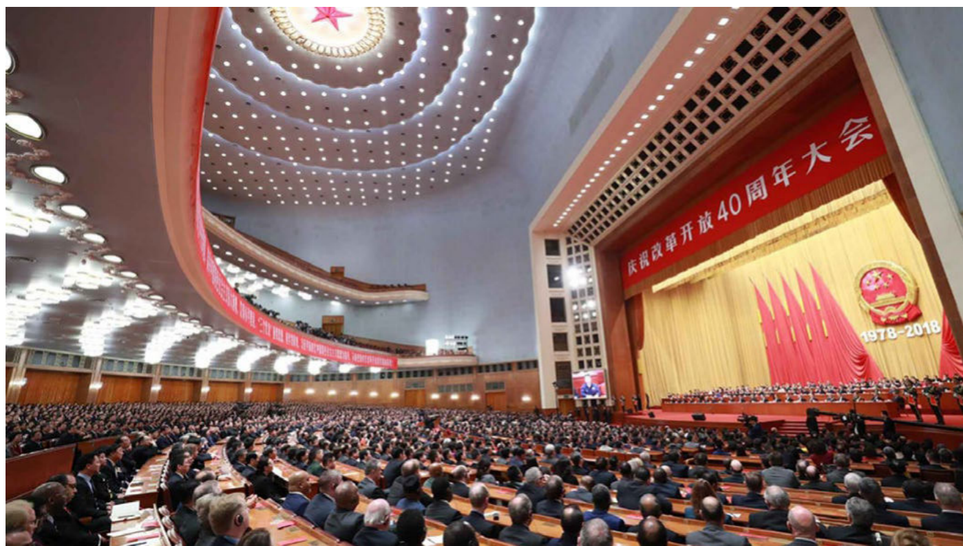
Figura 3. Discurso pronunciado por el presidente Xi Jinping en el marco de la celebración de los 40 años de la apertura económica de China.

Chinas ". Enfatiza además que en China "siempre ondeará la bandera del socialismo" y esta reforma y apertura iniciada por Deng Xiao Ping , en 1978 eran estrictamente necesarias para el desarrollo y la modernización de China.