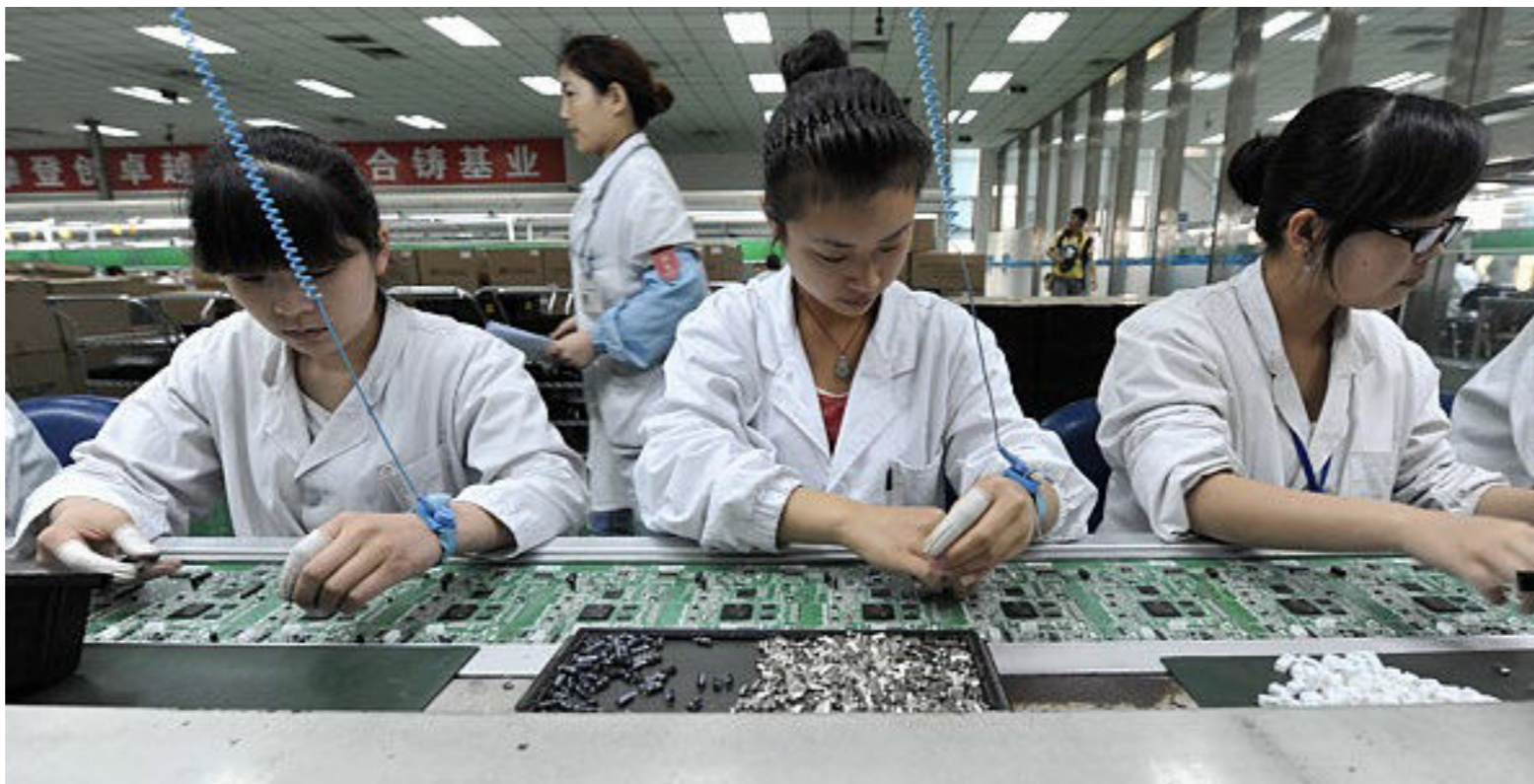
Figura 4. Una gran parte del éxito de Shenzhen que ha llevado a que se le conozca como el Silicon Valley chino es el ecosistema que ha creado. Si fabricas allí tienes a cualquier proveedor cerca: Qualcomm, MediaTek, Samsung, Intel... toda la “supply chain” está presente en la ciudad china.

La complementariedad entre Hong Kong y Shenzhen ha sido robusta. Hong Kong ha servido como socio comercial, financiero e intermediario para China, con contactos en Shenzhen en particular. Por otro lado, Hong Kong ha tenido un rápido proceso de industrialización que no hubiese podido sostenerse sin el suministro de alimentos, agua, energía y materias primas de Shenzhen y China, generalmente a precios mucho más bajos que los niveles mundiales. El elemento más importante de la integración económica entre