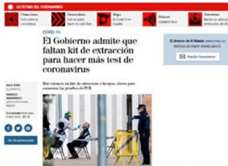
Fig 5. Escasez de estuches (kit) para el diagnóstico de SARS-CoV-2 en España (El Mundo, 08-04-2020).

Después de realizar tres ensayos, los resultados sugirieron que la metodología