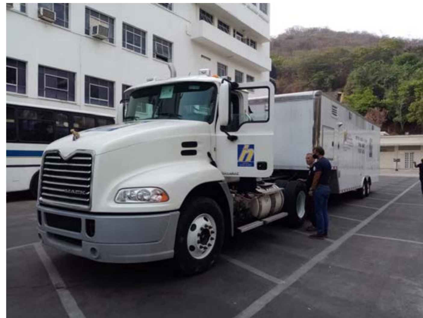
Fig 1. Unidad del Laboratorio Movil del INHRR con nivel de seguridad biológica 2 (NSB-2) del INHRR durante su acondicionamiento para salir al edo tyáchira con el objetivo de diagnosticar el SARS-CoV-2.

Paradójicamente, estos laboratorios se pensaron para el potencial uso ante la posible llegada del Ébola, que en esos momentos asolaba al territorio africano, pero nunca llegó a esta Tierra de Gracia , pero con la pan-