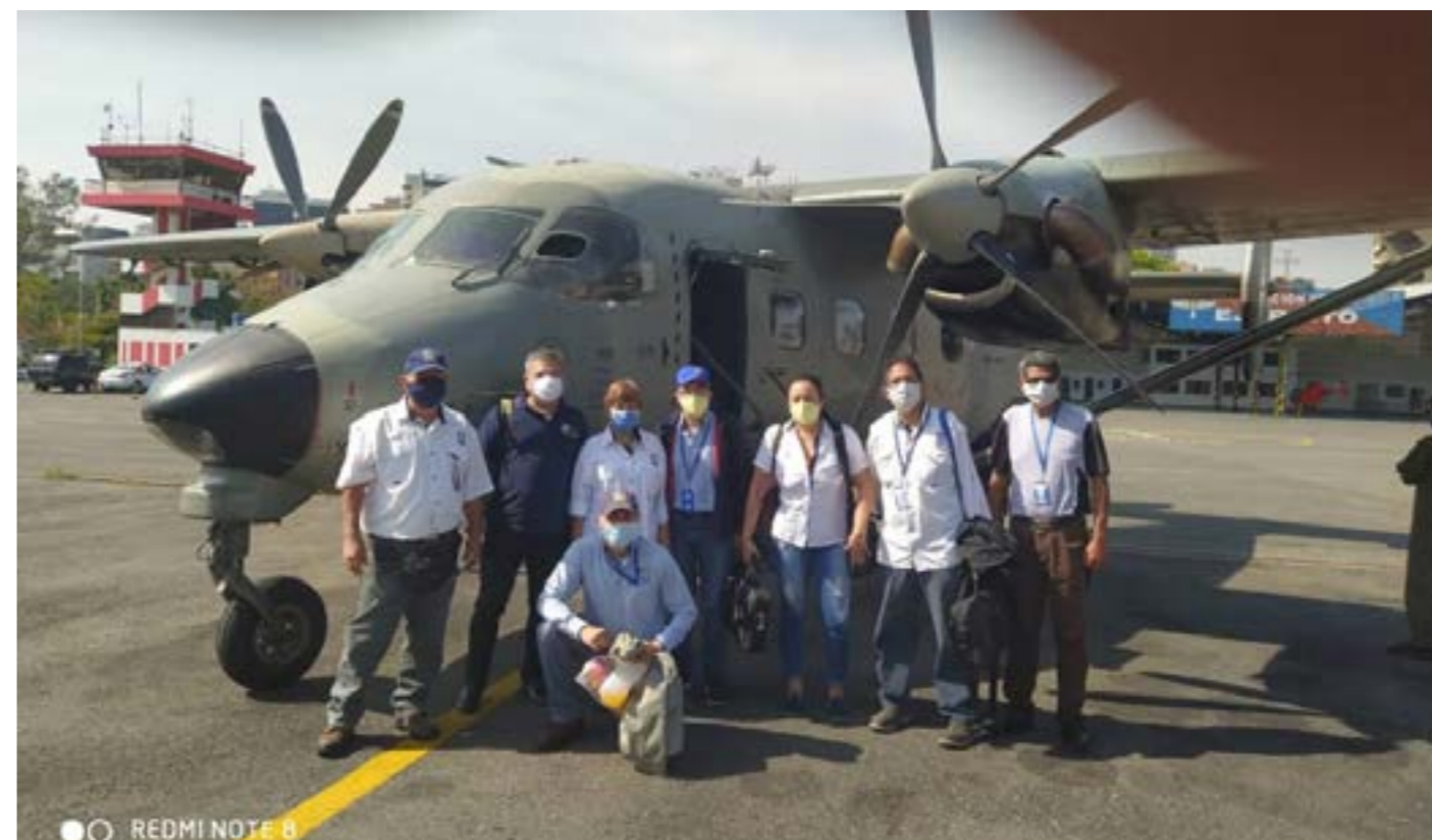
Fig 2. Parte del equipo tecnico y científico del INHRR que partían para el edo Táchira con el fin de trabajar en la Unidad del Laboratorio Movil del INHRR con nivel de seguridad biológica 2 (NSB-2) para el diagnóstico de SARS-CoV-2 (13-04-2020).