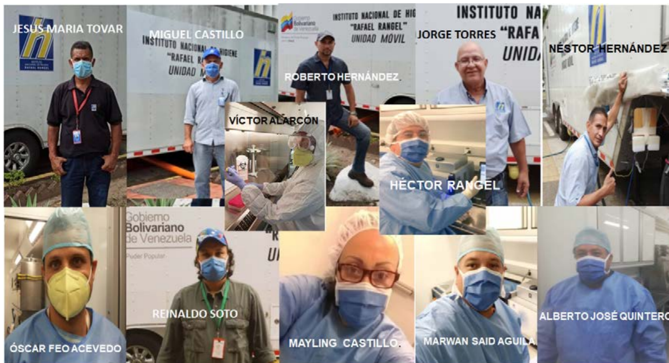
Fig 3. Parte del equipo técnico y científico del INHRR y del IVIC en el Edo Táchira trabajando en la Unidad del Laboratorio Móvil del INHRR con nivel de seguridad biológica 2 (NSB-2) para el diagnóstico de SARS-CoV-2 (18-04-2020).

Venezuela no escapa a esta realidad, y ante el gran riesgo de un agotamiento global en los inventarios de los kits de extracción de ARN, tanto aquellos provenientes de donaciones por países aliados y organizaciones Internacionales (OPS, UNICEF, entre otros),