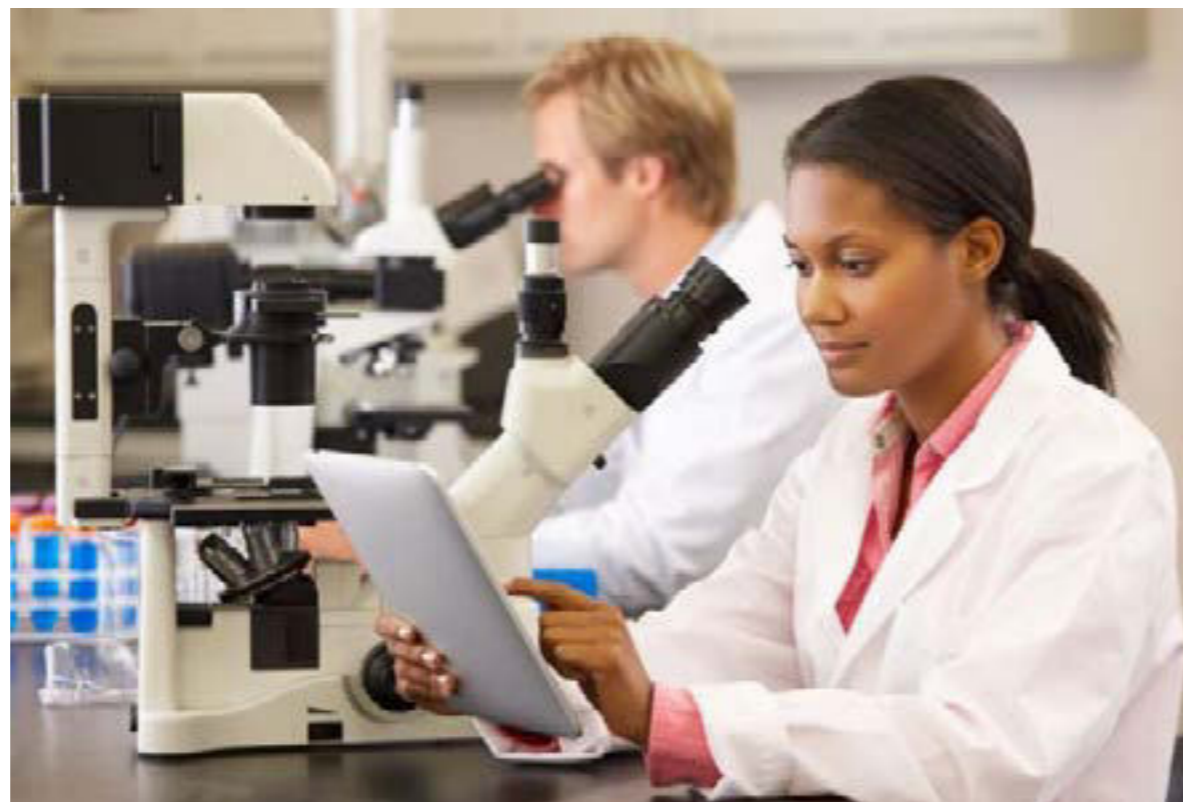
Figura 4. Las mujeres científicas de color, son aún más discriminadas.

En el artículo de Kramer (4) , continuando con su análisis, de diferencia de géneros en publicaciones sobre COVID-19, reportaron un trabajo donde analizaron más de 300.000 artículos denominados pre-print e informes registrados (descripciones de estudios planificados) en todos los campos de la ciencia y encontraron un patrón similar de mujeres que quedaron fuera de las investigaciones