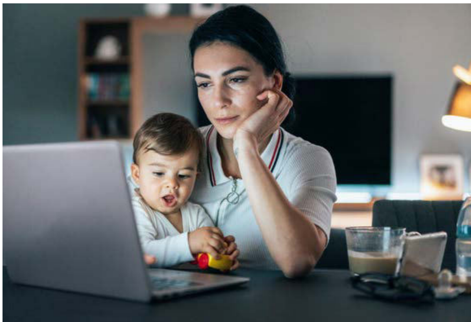
Figura 3. La mujer trabaja y se ocupa de sus hijos.

En el nivel universitario una proporción mayor de mujeres que de varones logra graduarse, con notas tan buenas o mejores que los hombres en la mayoría de las disciplinas, y una proporción también muy elevada de mujeres hace estudios de educación universitaria. Considerando este hallazgo, pareciera que la política de igualdad de oportunidades debiera enfocarse en las ingenierías, de esta forma incrementaría el número de mujeres en algunas carreras. De igual forma se debe pensar en incentivos que contribuyan a reequilibrar los números en otras disciplinas que han pasado a ser prácticamente todas femeninas.