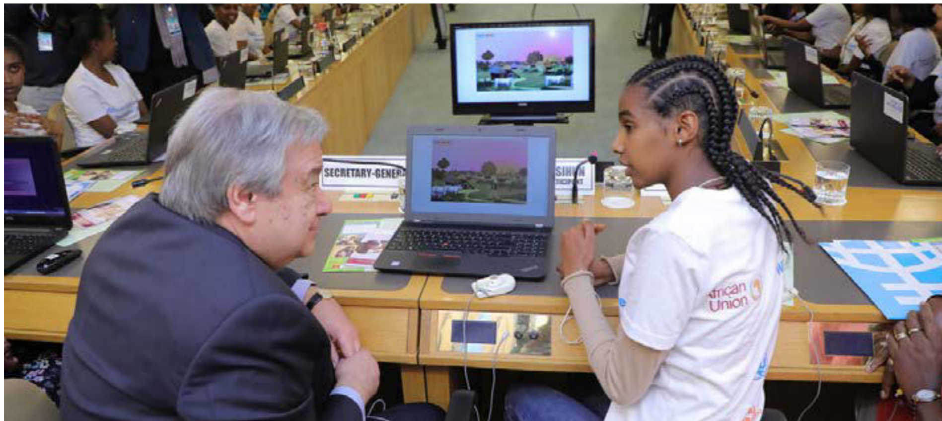
Figura. 1. El Secretario General de la ONU, Antonio Guterres en el evento de ciencia, tecnología, ingeniería y matemáticas centrado en codificación digital durante la 32ª Asamblea de la Unión Africana en Addis Abeba, Etiopía.

Se resaltó igualmente, que solo el 30 % de los investigadores de todo el mundo son mujeres. Esta disparidad en las ciencias es producto de diversas razones, dentro de las que destacan: la priorización de este tipo de educación en los niños, los prejuicios de género y estereotipos, a lo que se une la brecha digital mundial (que es la separación que existe entre los países que tienen más acceso a internet y sus servicios y los que menos), “que castiga desproporcionadamente a las niñas y las mujeres” . Indicando además que hay muy pocas mujeres en puestos de toma de decisiones y en los empleos mejor remunerados de ciencia, tecnología, ingeniería y matemáticas.