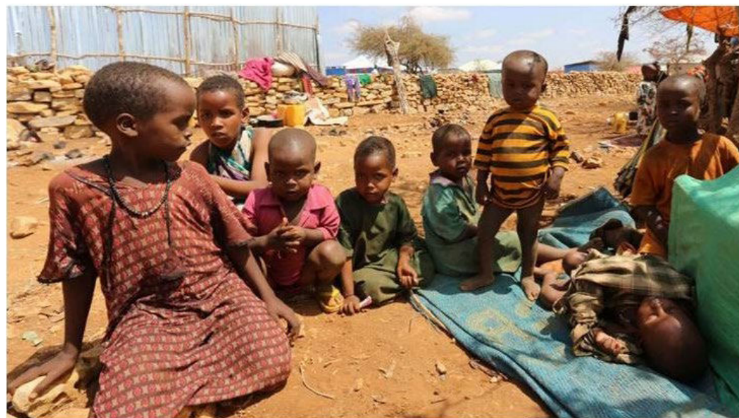
Figura 1. Hambruna, sequía y cólera en Somalia.

Cuerno de África han acabado con la mayoría de los cultivos y el ganado, los cuales representan los principales activos de muchas familias. La situación se ve agravada por el cambio climático y el incremento de la plaga de langostas que