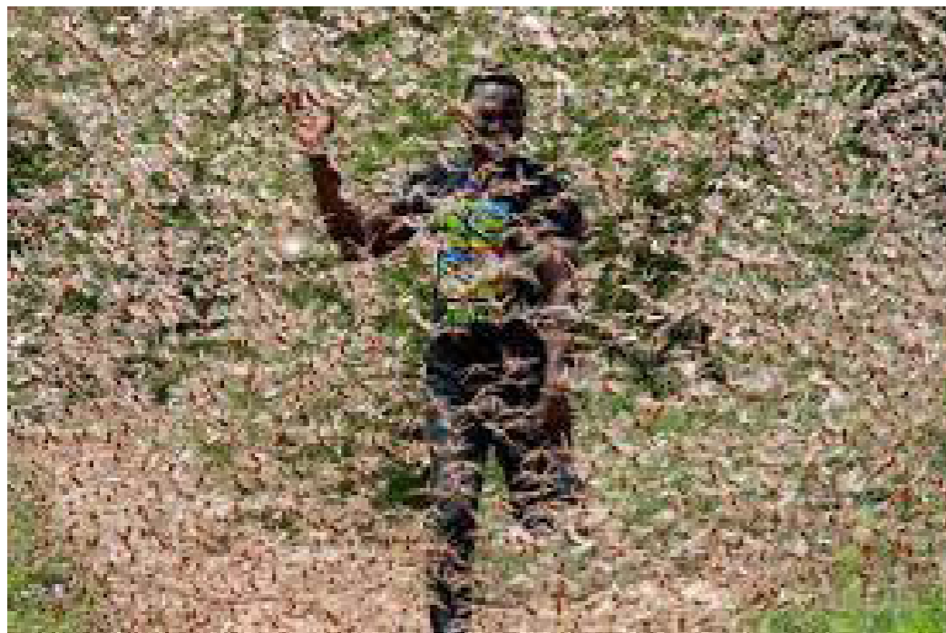
Figura. 2. Una foto de Kenia grafica la bíblica plaga de langostas que azota la región. | EFE.

CA8430EN.pdf) está clasificada como riesgo bajo. Los autores cambian esta clasificación debido a que el índice de precios de alimentos del país, ha presentado importantes aumentos en los últimos años (en diciembre 2019 estuvo cerca del 8.000 %, según el Banco Central de Venezuela ( http://www.bcv.org.ve/estadisticas/consumidor ), por ello justifican la reclasificación del país dentro de los países de riesgo alto.