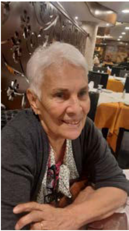
Profesora Titular. Facultad de Medicina UCV. Socióloga egresada 1964-UCV. Magister en Sociología Médica (Universidad de Houston); Ph.D. Epidemiología y Ciencias Ambientales (Universidad de Texas). Profesora en Ciencias del Desarrollo Estratégico, CESACODEVI. UBV, Caracas, Venezuela.

SH?: ¡Chito! 2 Tal como dicen e imagino que diría el General Juan Vicente Gómez en la Venezuela de sus tiempos (Peñaloza, 2013). ¡Así mismo, chito! para referirse al sexo y lo sexual, puesto que el tema situaba en el chisme, las risas y la inferioridad-animalidad. ¿Y por qué?